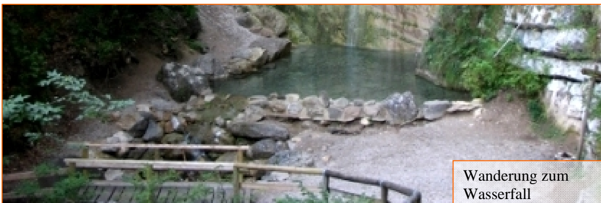
Wanderung zum Wasserfall