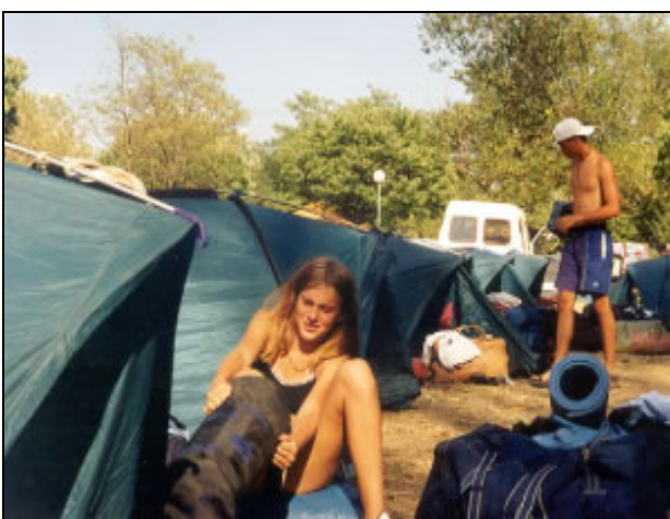
Biwakübernachtung während der Kanutour