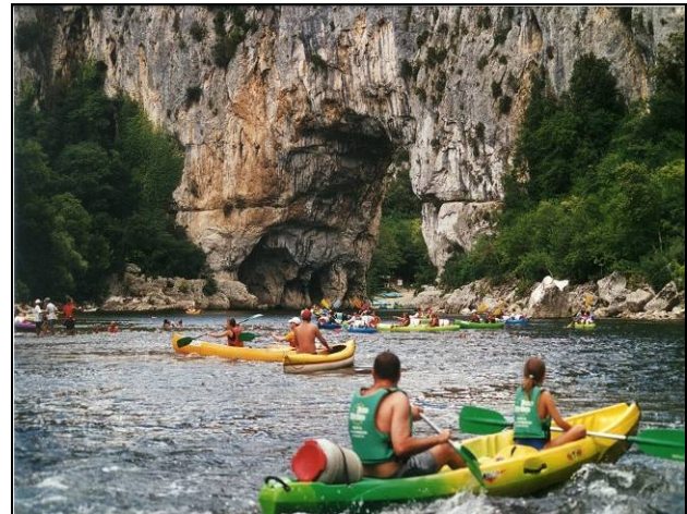
Kanutour auf der Ardèche inkl. Biwakübernachtung