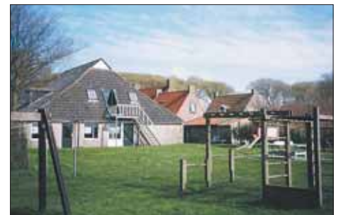
Hof 7 liegt in Ballum inmitten des denkmalgeschützten Ortskerns.

können wir Ihnen viele weitere Gruppenhäuser auf der Insel anbieten. In Ballum, dem Hauptort der Insel, wohnen unsere Gäste in zwei ehemaligen Höfen. Auch in Hollum, dem zweitgrößten Ort der Insel, sind zwei der drei Häuser alte Bauernhöfe. Das macht die besondere Atmosphäre der Ameland-Häuser aus. Platz haben wir hier für Gruppen von 21 bis 100 Personen. ◀