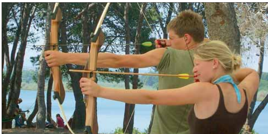
Zur Ausstattung des Sportcamps auf Sardinien gehört neben Mountainbikes, Kanus und Ballsportplätzen auch eine Bogenschießanlage.

Im Sportcamp auf Sardinien machten unterschiedliche Jugendgruppen gemeinsam Ferien