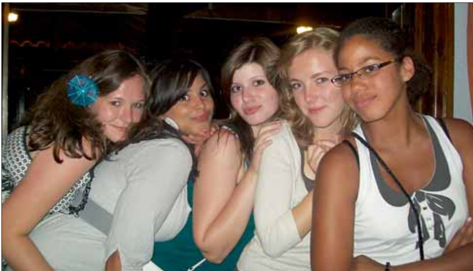
Was wäre eine gelungene Ferienfreizeit ohne Party? Auf Korfu griffen alle zum Karaoke-Mikrofon.